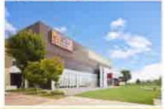
三井アウトレットパーク 北陸小矢部

●バス停以外でバスから降りるとき お早めに降りる場所をわかりやすく運転手に申し出てください。