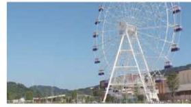
三井アウトレットパーク 北陸小矢部