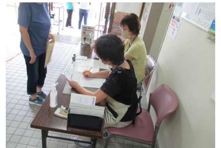
がん検診受付補助