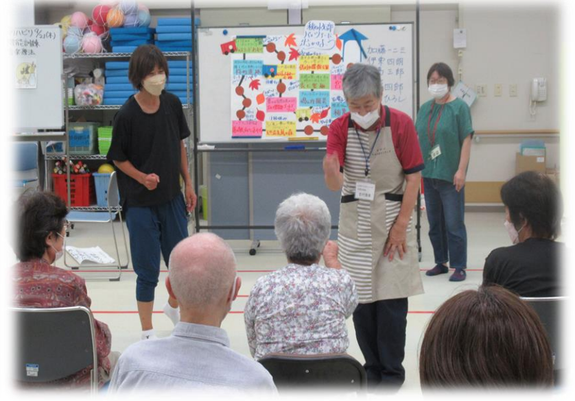
機能訓練事業進行補助