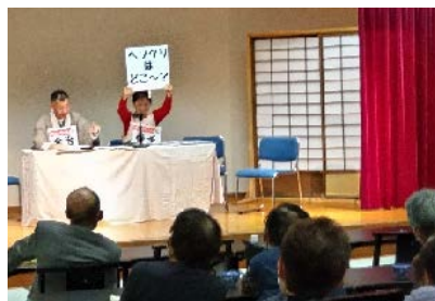
★令和5年12月7日宮島地区 滝乃荘