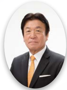
小矢部市長 桜井 森夫

令和6年の年頭にあたり、謹んでごあいさつを申し上げます。 まずは、令和6年能登半島地震により被災された方々にお見舞いを申し上げます。