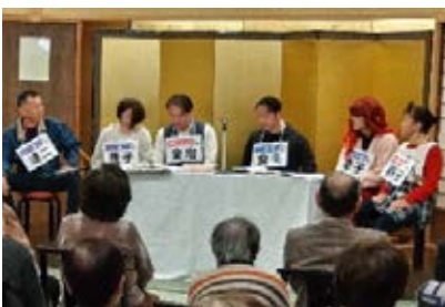
★令和5年11月23日石動東部 ばんば