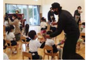
○フラワーバレンタイン