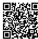
厚生労働省 関係資料の ダウンロード

・改正のポイント 令和5年4月から、中小企 業を含む全ての事業場におい て、月60時間を超える法定時 間外労働に対する割増賃金率 が50%(現行25%)となります (大企業は適用済み)。 ※割増賃金の引き上げに合わせ て、就業規則の変更が必要と なる場合があります。