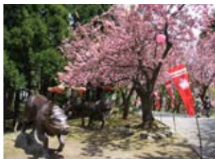
▲俱利伽羅古戦場 (火牛の像と八重桜)

押寄する、前後四万余騎が関の声、山も崩れ岩も摧らんと夥し」と刻まれており、木曾義仲が火牛を用いて平家に夜襲をかけた様子がかげえまます。