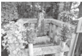
▲松尾芭蕉の墓 (義仲寺 (滋賀県大津市))