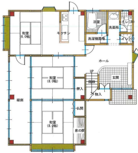
1階 平面図 S:1/100