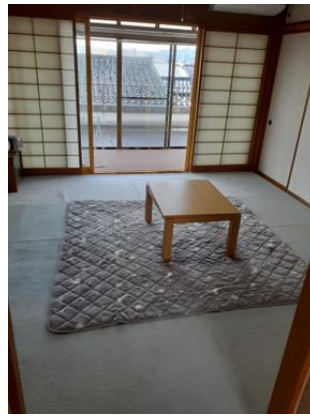
和室 (8帖)、サンルーム