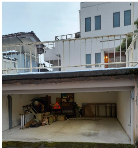
車庫の高さは低い（セダンタイプOK）