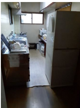
台所（手前から撮影）