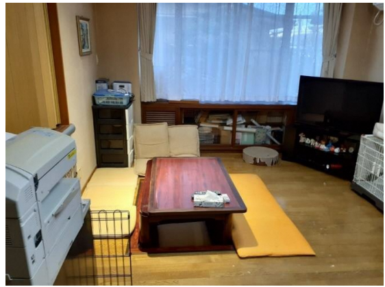
ダイニングテーブル&チェアセット、食器棚 掘りごたつ&テレビ、うさぎと猫のゲージ有