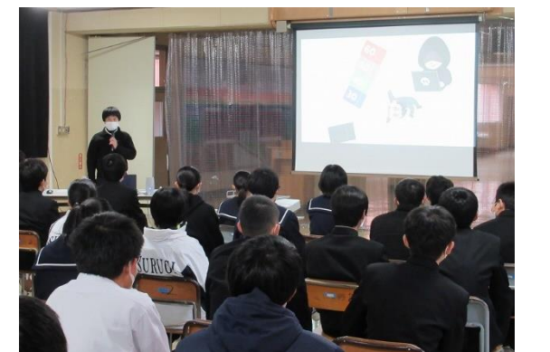
【情報モラルについて考える生徒】

タブレット端末は、学校だけでなく、 家庭での主体的な学習 にも活用していきます。 そのために、学校では、タブレット端末の 使用目的 や 個人情報の取り扱い 等のルールを守った使い方及び、 健康面（視力・睡眠等） にも 配慮 した使い方について、保護者の理解と協力の下、 全ての学年で指導 します。