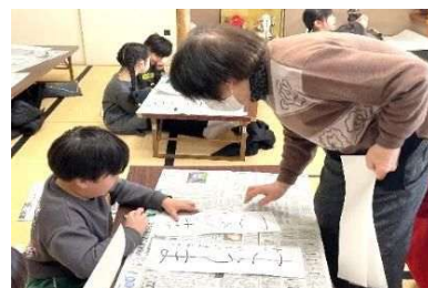
かきぞめ教室(低学年)