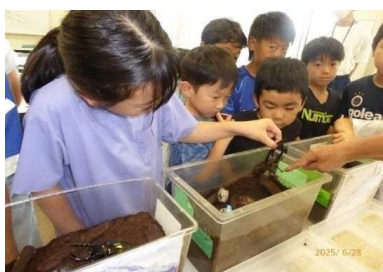
昆虫たちみんなちがうねおもしろいね！