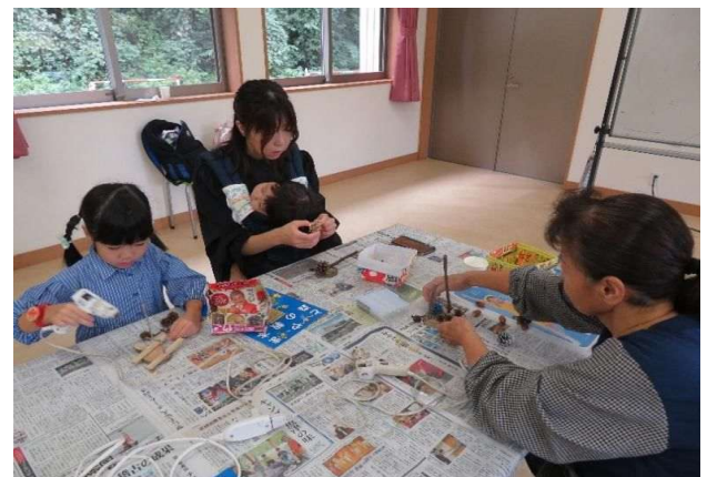
森のオブジェ作り