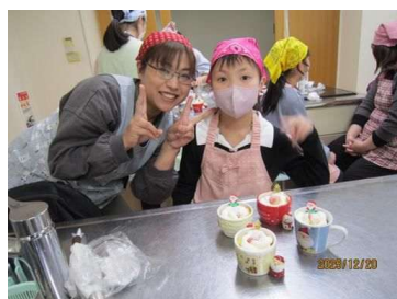
クリスマスケーキ作り