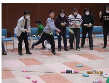
クリスマスふれあい交流会