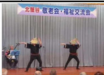
○敬老会、福祉交流会(6/22)