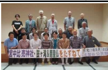
○ふる里おやべ再発見バスツアー(9/18)