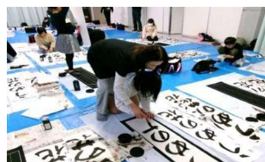
かきぞめ教室(高学年)