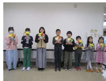
フラワーアレンジメントにチャレンジ