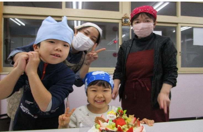
クリスマスケーキ作り