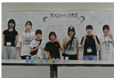
おもしろ理科実験