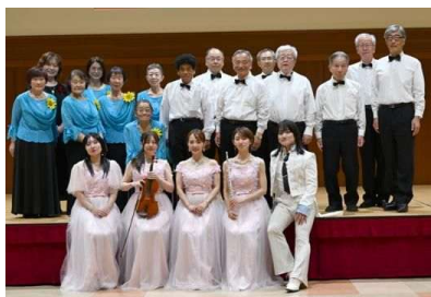
音楽を楽しむつどい