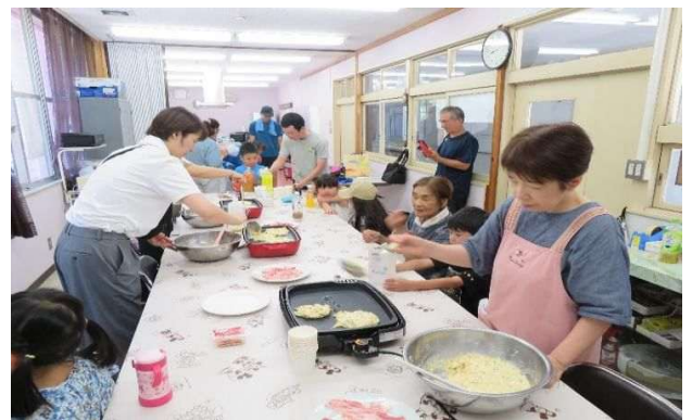
お好み焼き 試食の様子