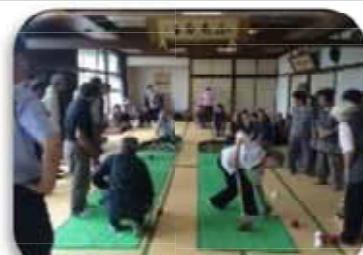
わくわく出前教室