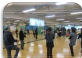
ニューススポーツ出前教室