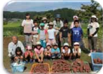
○さつま芋掘りと芋スタンプで遊ぼう○