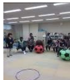
わくわく出前教室