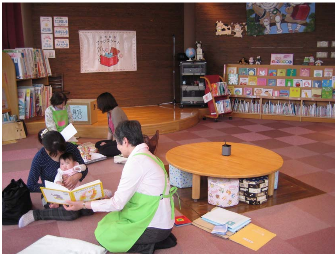
ブックスタート(おとぎの館図書室語り部の部屋)

ブックスタート後の継続的な読書習慣を育てるための援助として、1歳半・3歳児健診会場において、図書館職員が月齢に応じた絵本の展示や図書館の利用案内を行った。