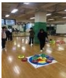
ニュースポーツ出前教室