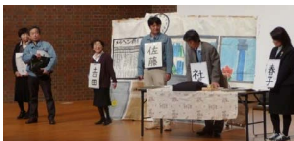
男女共同参画市民フォーラム