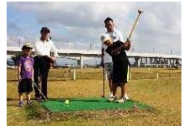
パークゴルフ教室の様子

子どもからお年寄りまでが、いろいろなスポーツにチャレンジし、心を通わせながら楽しむ機会を提供し、市民の健康づくりやコミュニティ形成に寄与することを目的とし、実施している。