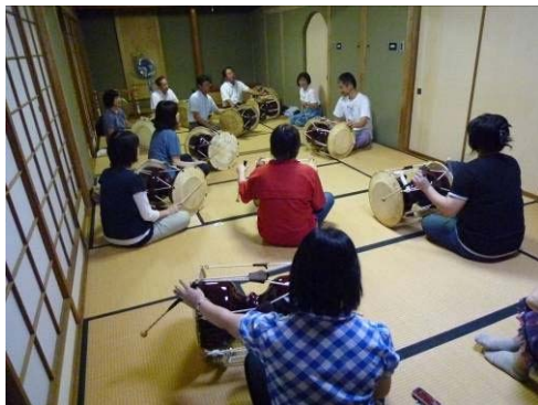
講座7 はんりゅう 韓流教室