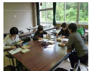
講座2 きめこみ手芸教室