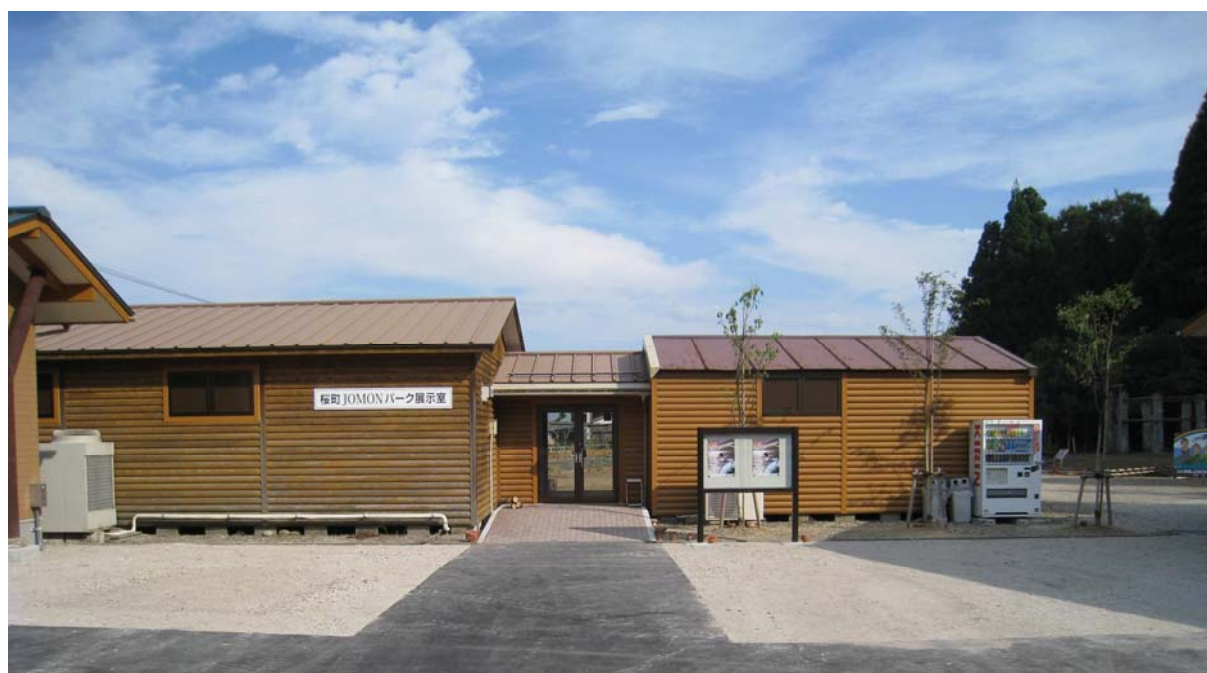
桜町 JOMON パーク 展示室の開設