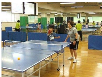
わんぱくチャレンジ（卓球）