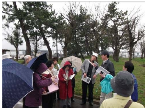
講座9 歴史セミナー (正得地区)