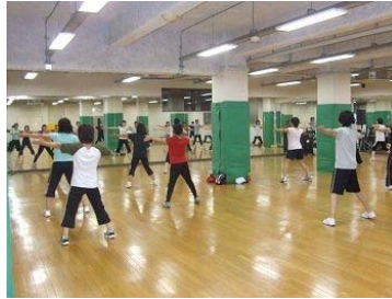
かんたんエアロ教室