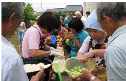
三世代で楽しむ流しそうめん