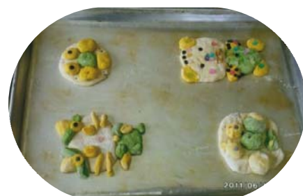
6月 パン作り体験教室 世界に一つだけのオリジナルパン！