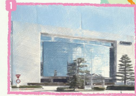
1 ゴールドワイン TEL0766-61-4800 アスリートから一般のスポーツファンまで、幅広い方を対象に、数多くのブランドを展開するスポーツアパレルメーカー。一般の方の見学もできます(要予約)