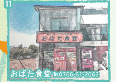
11 おばた食堂 TEL0766-61-2062 味とまごころの店。津沢のソウルフード「まんぷく定食」などボリュームある定食をはじめ、丼・麺類・おつまみなども充実しています。