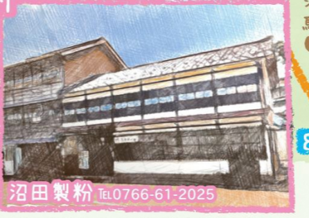
7 沼田製粉 TEL0766-61-2025 天保元年創業。長い歴史と伝統技術を積み重ね、昔ながらの自然素材にこだわり、手延べ麵の味わいを残しつつ、美味しさを追求し続ける鶴亀手延べ乾麵を作る会社です。