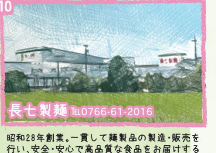
10 長七製麺 TEL0766-61-2016 昭和28年創業。一貫して麺製品の製造・販売を行い、安全・安心で高品質な食品をお届けするとともに新しい食文化を提案しています。

この地図は、平成30年11月現在の調査をもとに作成しています。まちは常に変わりますので、具体的な内容は各施設にご確認ください。