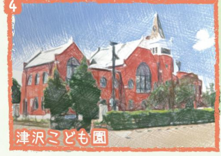
4 津沢子ども園 市内に点在するメルヘン建築の一つ。本体は東京赤坂にあった旧聖南坂教会をモデルにしており、正面入口部分は迎賓館をモデルにしています。