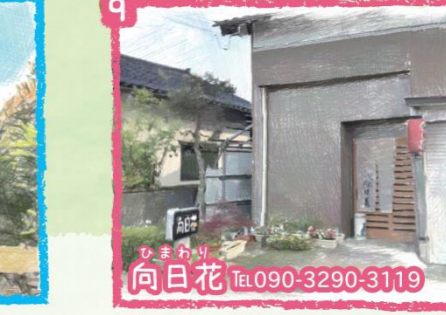
9 向日葵 TEL090-3290-3119 元気になる癒しの居酒屋。小さな空間に多くの人が集まり、元気に咲くヒマワリのように、そして、笑顔が集うようにと名付けられた、「姉御肌の女将」と「手作り料理」が売りの店です。