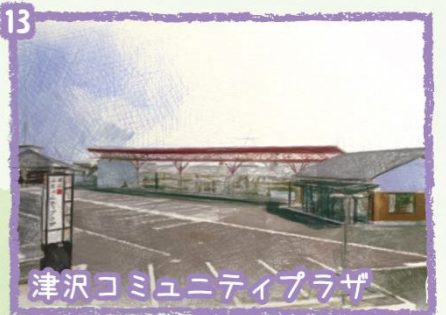
13 津沢コミュニティプラザ 多目的ホール、会議室、和室、調理実習室など、様々な会議・活動に対応可能な施設です。図書コーナー、学習室もあります。