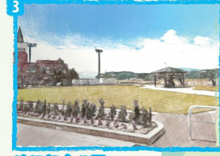
3 津沢記念公園 旧津沢小学校跡地を公園として整備したものです。その一面には七福神の一つである大黒天像が建っており、公衆トイレも整備されています。