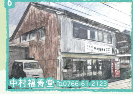
6 中村福寿堂 TEL0766-61-2123 美味しい和菓子屋さん。防腐剤等の添加物は一切使用しない味にこだわったお店。甘さ控えめのオリジナルすまき・おはぎ・草餅などは是非ご賞味ください。