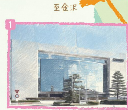
1 ゴールドワイン TEL0766-61-4800 アスリートから一般のスポーツファンまで、幅広い方を対象に、数多くのブランドを展開するスポーツアパレルメーカー。一般の方の見学もできます(要予約)

津沢地区は小矢部市の南部に位置し、市街地が形成されています。「津沢夜高あんどん祭」が有名で、活気がありつつも、穏やかで落ち着いた街並みは、どこか懐かしさを感じさせます。是非ゆっくりと散歩してみてください。