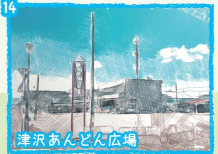
14 津沢あんどん広場 夜高あんどんの中心地。ここがメイン会場となり毎年6月の第1金曜日・土曜日の夜に「津沢夜高あんどん祭」が開催されます。