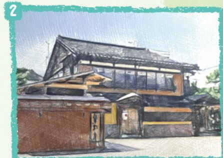
2 魚政亭/月あかり TEL0766-61-2056 魚政亭は大正ロマン風情が漂う、はいから日本料理店。別館の月あかりは英国家具を配したレトロな洋室で、靴のまま椅子席で、楽にご会食できます。