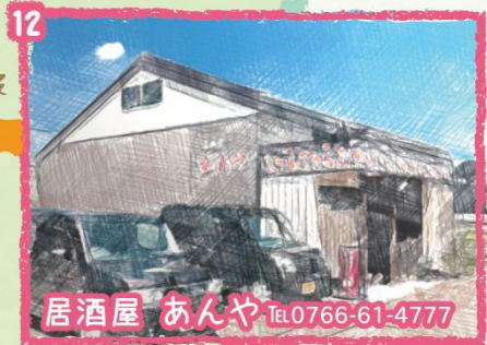
12 居酒屋 あんや TEL0766-61-4777 一年中、津沢夜高あんどんの吊り物を見ながら飲食を楽しめるお店。原寸大の吊り物の迫力と色彩は本当にすごい! 家族やお友達、仲間と集まるには最適です。