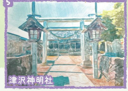
5 津沢神明社 天和年間(1681年~83年)が起りりとされ、津沢地区の総鎮守として長く住民に親しまれています。現在の社は、大正期に改築されたものです。