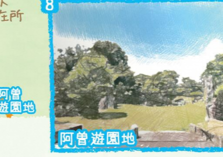
8 阿曾遊園地 万治3年(1660年)に津沢の町立を行った阿曾三右衛門の墓がある緑地公園。阿曾三右衛門の像が建っておりゆっくりと過ごせます。