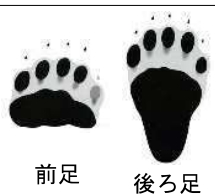
ツキノワグマの足跡

山菜はクマも好物です。山菜の多いところにはクマもいることが多いので、足跡や糞などを見つけたら引き返しましょう。