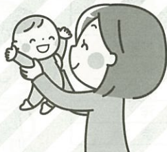
お母さん同士のフリートーク