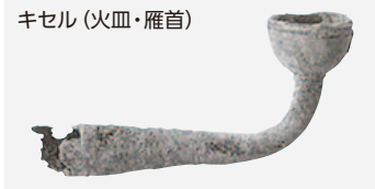
キセル(火皿・雁首)

江戸時代は、たばこ火の不始末による火災などが多発したことから一般庶民の間では禁止される傾向にあり、キセルを煙管筒に入れ、煙草入れと共に持ち歩いたのは一部の商人と武士階級だったようです。