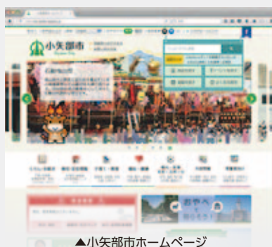
▲小矢部市ホームページ

4月から、市のホームページが新しくなりました。リニューアルの主なポイントを4つご紹介します。