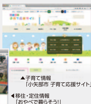
▲子育て情報 「小矢部市 子育て応援サイト」