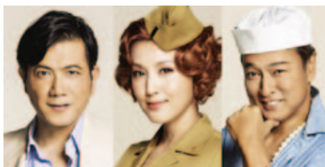
別所哲也 藤原紀香 太川陽介

日時 7月26日(火) 18:00開演(17:30開場) 会場 メインホール 出演 藤原紀香、別所哲也、太川陽介 ほか 料金 全席指定 S席 4,000円、A席 3,000円 【未就学児入場不可】 取扱 クロスランドおやべ