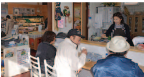
◀気軽に立ち寄れるカフェコーナー