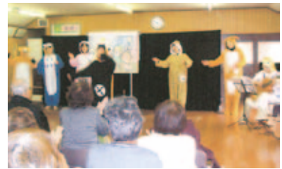
▲観客も歌や手拍子で参加しています

事業費 129,486円(うち補助金額90,000円) 事業費内訳 紙芝居用模造紙代、衣装用布地代、ボランティア活動保険料等