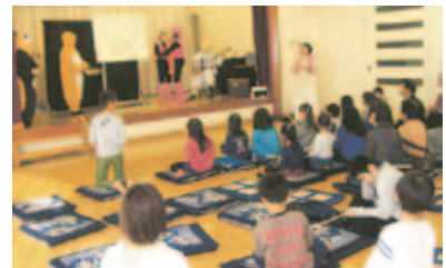
▲地域の3世代交流でも講演し、幅広い世代に楽しんでもらっています