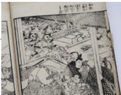
◀焼け落ちる法住寺殿(「義仲勲功図會」より)