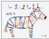
しましましましょ 北村 人作