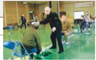
フライングディスク 競技会

実施団体 花しょうぶ会(小矢部市身体障害者協会)(参加者数 延べ45人) 事業内容 社会参加の機会が少ない身体障害者の社会参加活動を図り、健康増進と“生きがいのあるまちづくり”を目的とする。 ひと言 閉じこもりの身体障害者の社会参加活動を図ることができました。また、リハビリを兼ねた健康増進および仲間同士の声の掛け合いによる生きがいの形成を図ることができました。 事業費 172,663円(うち補助金額129,000円) 事業費内訳 消耗品費、印刷製本費、会場使用料等