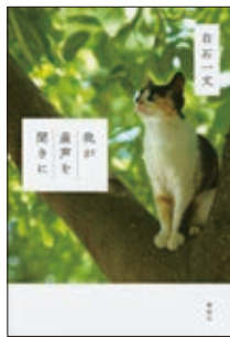
我が産声を聞きに 白石 一文 著