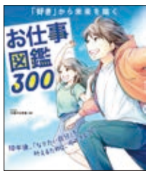
お仕事図鑑300 16歳の仕事塾 監修