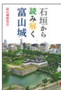
石垣から読み解く 富山城 富山城研究会 著