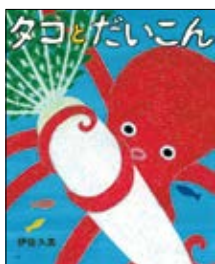
タコとだいこん 伊佐 久美 著