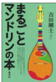
まるごと マンドリンの本 吉田 剛志 著