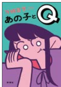
あの子とQ 万城目 学 著