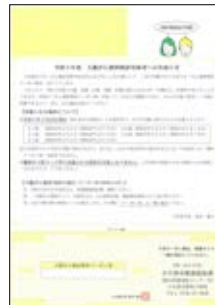
(大腸がん無料クーポン券)