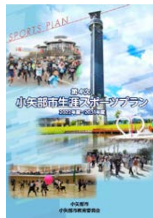
第4次小矢部市生涯スポーツプラン （市ホームページに掲載してありますので、ご覧ください。）

令和4年度（2022年度）から令和13年度（2031年度）までを計画年度とし、目標年度を令和13年度（2031年度）としています。