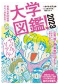
大学図鑑! オバタ カズユキ 監修