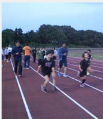
小矢部市陸上競技場での 市民開放デイ