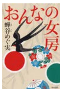
おんなの女房 蟬谷 めぐ実 著