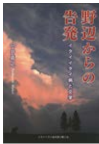
野辺からの告発 イタイタイ病と文学 向井 嘉之 著