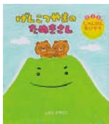
げんこつやまの たぬきさん とよた かずひこ作