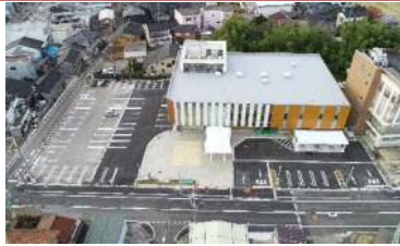
市民交流プラザ整備費 907万円