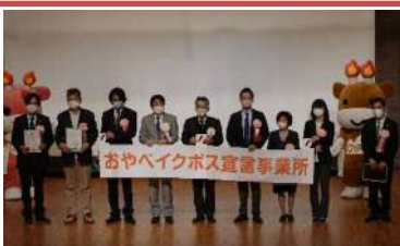
男女共同参画に関する費用 26万円