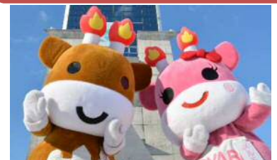
メルギューくん、メルモモちゃんの 活動経費等 20万円