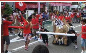
おやべ祭り開催費用 138万円