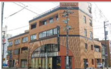
地域・まちなか商業活性化事業 21万円