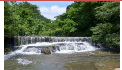
倶利伽羅及び稲葉山・宮島峡の 環境整備 100万円 環境美化・緑化推進費 230万円