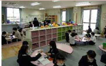
放課後児童クラブ運営費 663万円