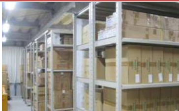
災害時備蓄品の整備 132万円 防犯カメラ整備 90万円