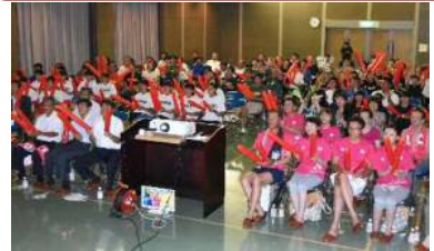
オリンピック振興事業 173万円