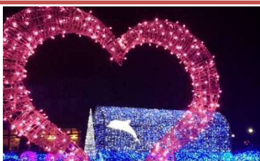
おやべイルミ開催経費 8万円

※昨年、おやべイルミを存続させるためのガバメントクラウドファンディングを7月から9月にかけてを実施したところ、市内外の多くの皆様からご寄附をいただきました。