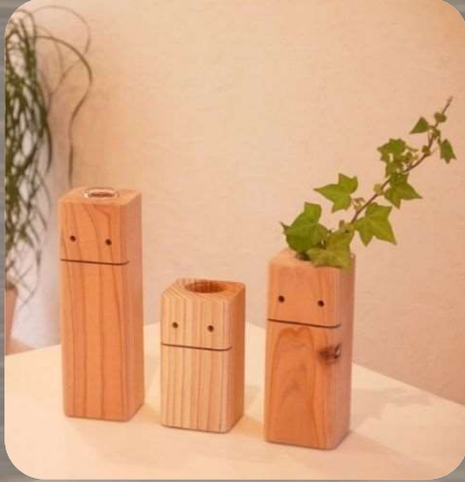
No.57 富山の杉の一輪挿し ぴたっとchu(チュウ)