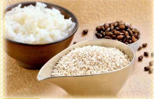
No.41 はとむぎ精白粒セット