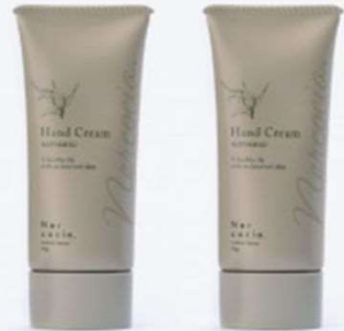
No.69 はとむぎハンドクリーム