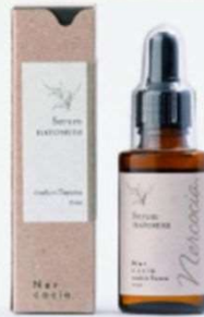
No.42 はとむぎ美容オイル