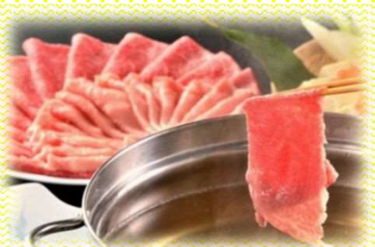
No.153 すき焼き用コース