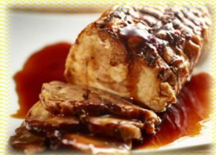
No.66 チャーシュー丼セット