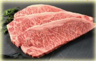
No.123 メルヘン牛ステーキ