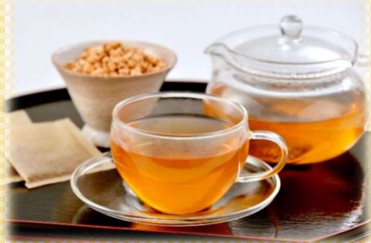
No.40 はとむぎ茶 ティーバッグ