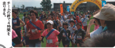
チームの持ち4時間走りきりました。