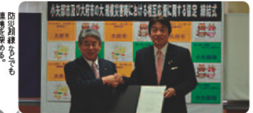
防災訓練なども連携を深めます。