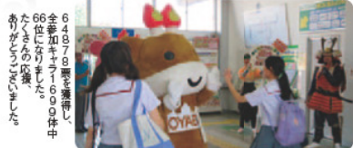
66名が参加し、6名が優勝しました。