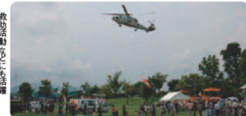
救助活動にも活躍