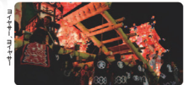
ヨイヤサーヨイヤサー