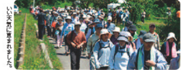
いよいよ準備が完了しました。