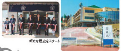
新たな歴史をスタート