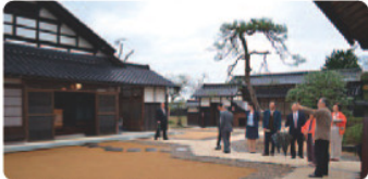
11月2日に、国指定有形文化財(建造物)に指定されました。