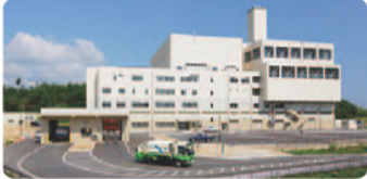
環境に配慮しています。