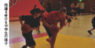
指導を受け、中学生の様子