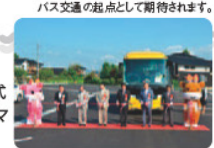
バス交通の起点として期待されます。