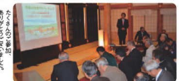
たくさんの方に参加