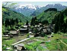
世界遺産五箇山合掌造り集落（相倉集落） ／南砺市