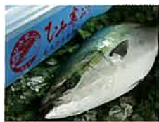
「富山湾の王者」ひみ寒がり ／氷見市