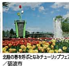
北陸の春を呼ぶとらなみチューリップフェア ／砺波市