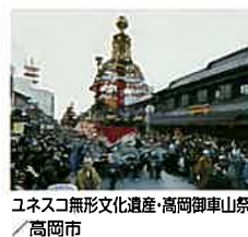
ユネスコ無形文化遺産・高岡御車山祭 ／高岡市