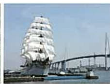
「海の貴婦人」と呼ばれる帆船海王丸 ／射水市