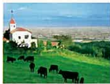
優良和牛を育成する稲葉山牧野 ／小矢部市