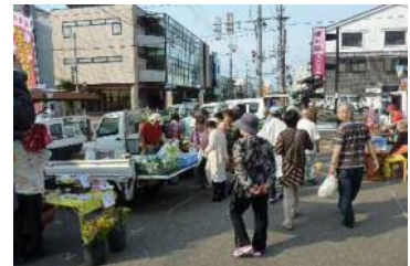
おやべ楽市事業 35万円