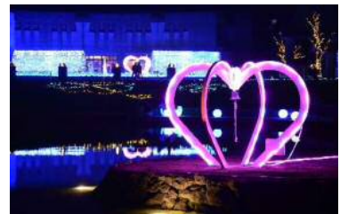
おやべイルミ開催 83万円