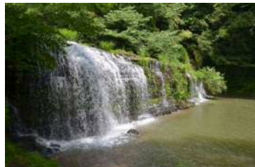
稲葉山・宮島峡環境整備 54万円 俱利伽羅環境整備 3万8千円