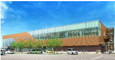
新図書館の図書購入 68万円