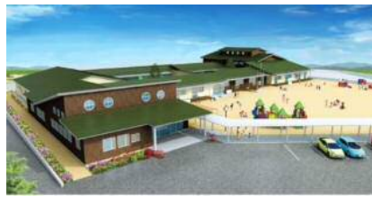
大谷・蟹谷学区の統合こども園 備品購入 163万円