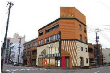
石動駅前商工会ビル運営補助 1,000万円 総合戦略策定経費 308万5千円