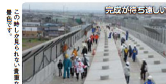
この時しか見られない貴重な景色です。