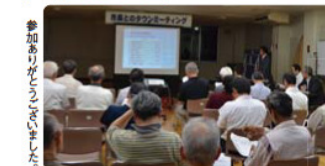
参加者がたくさん集まりました。

1～2日 津沢夜高行燈祭り 15日 平成24年度市長のタウンミーティング (～8月9日・全18回)