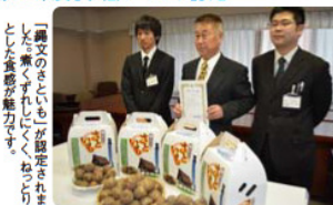
「調文のさといも」が認定されました。食料が能力です。

6日 高等学校生徒合同海外派遣研修団出発式 19日 平成23年度小矢部ブランド認定