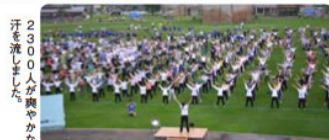
2300人が爽やかな汗を流しました。

8日 ロンドンオリンピック出場村上監選手激励社行会 特別巡回ラジオ体操 みんなの体操会