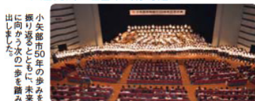
小矢部市50年の歩みを見つめ、未来を歩む一歩を踏み出しました。