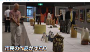
市民の作品がずらり