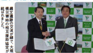
調文産物の交流が盛んで、大規模災害時の相互援助協定が結ばれました。