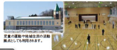
児童の運動や地域住民の活動拠点としても利用されます。

2日 おやべ・ひみ・たかおかビジネス交流交歓会in名古屋 23日 石動小学校屋内運動場(体育館)竣工式