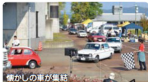
懐かしの車が集結