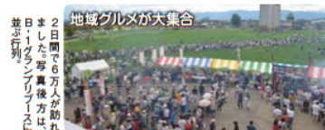
2日間、6万人が訪れました。写真後方は、日1グループの並び行列。