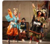
子どもたちによる史劇も上演されました。