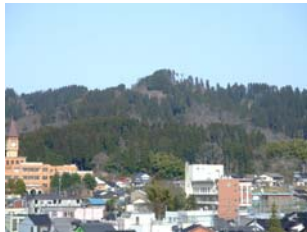
今石動城歩道整備の財源 として99万7千円