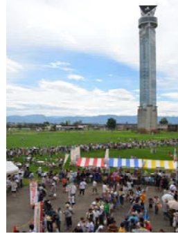
おやべ魅力発信交流 イベント開催の財源に 100万円