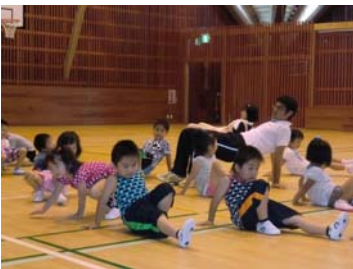
保育所等コーディネーション トレーニングの財源として5万円