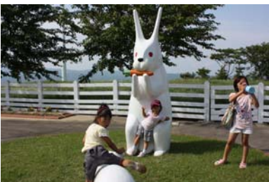
稲葉山環境整備の 財源として11万1千円