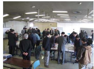
防災出前講座の財源として1万円