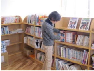
小・中学校図書館司書の 時間延長の財源として 180万円