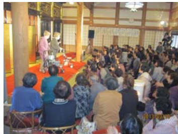
おやべ亭演芸会開催補助金の 財源として1万円