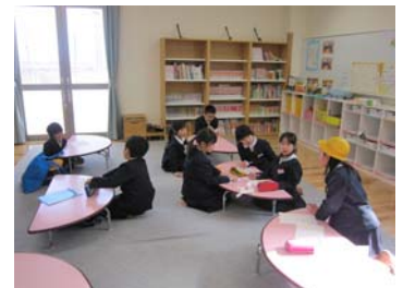
放課後児童クラブ 対象児童4～6年生拡充の 財源として5万円