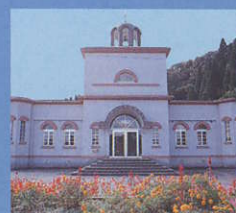
9 旧岩尾滝保育所 Former Iwaodaki Nursery School ピザンチン様式の東京神田お茶の水のニコライ堂