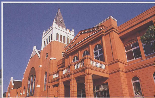
4 津沢保育所 Tsuzawa Nursery School 本体は東京赤坂にあった旧霊南坂教会、正面入口は迎賓館。