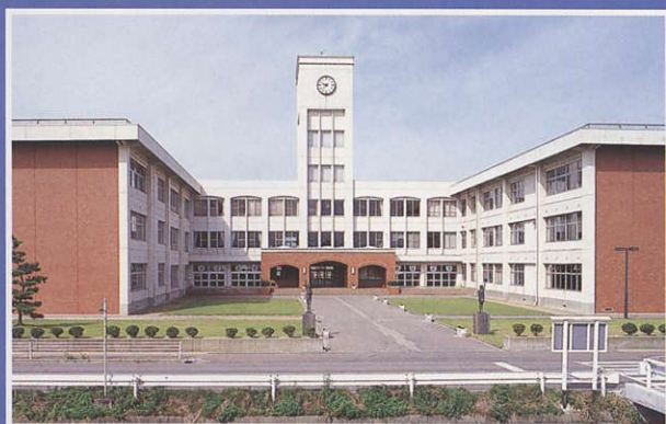
3 津沢小学校 Tsuzawa Elementary School 体育館は早稲田大学坪内演劇博物館、廊下を広くとっている。