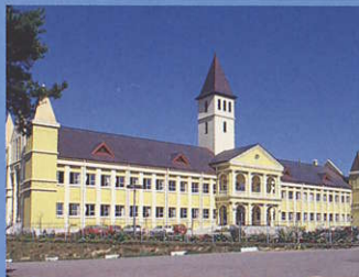
12 知的障害者更生施設 溪明園 Keimeien Institute for the Mentally Handicapped オーストリアのシェーンブルン宮殿、採光は東京丸の内の三菱銀行本店