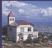
⑲ 稲葉山牧野看視舎