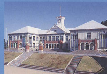
13 小矢部市教育センター(旧岩尾滝小学校) Oyabe City Education Center (Former Iwaodaki Elementary School) 中央は札幌時計台、校舎は旧制金沢第四高等学校・北海道大学理学部