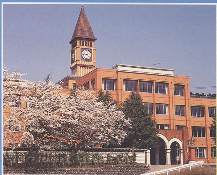
6 石動中学校 Isurugi Junior High School キャッスル・オブ・スピリットと呼ばれるスイスの中世の城をモデルに、中央の時計台は英国の国会議事堂ビッグベン、一階ピロティは東大法学部、建物は田の字型に4ヶ所が吹き抜けになっている。