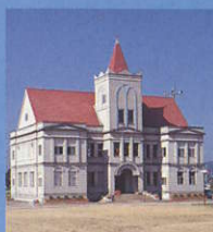
7 荒川公民館 Arakawa Community Center 本体はバッキンガム宮殿、塔屋はノートルダム寺院、窓は赤坂プリンスホテル