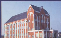
31 武道館 (情道館)