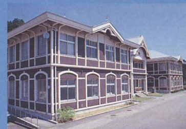
11 特別養護老人ホーム 清楽園 Seirakuen Old People's Home 国の重文である軽井沢の旧三笠ホテル