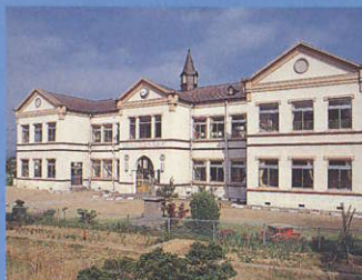
10 荒川保育所 Arakawa Nursery School 国の重文である国立近代美術館工芸館