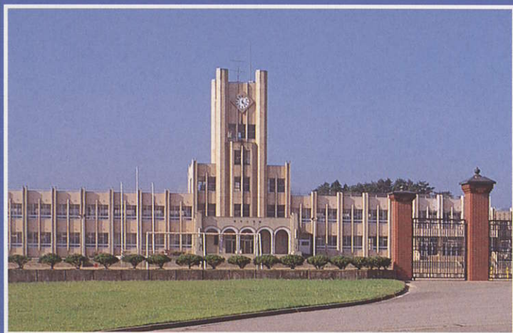
2 蟹谷小学校 Kanda Elementary School 校舎と時計台は東大教養学部、体育館は一橋大学の兼講堂。