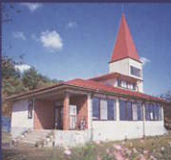
⑱ 林間休養施設(恵林館)