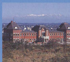
8 サイクリングターミナル Cycling Terminal ルネッサンス様式の東京駅がモデル(実物の1/5)宿泊施設。